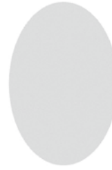
救急科/高度救命救急センター